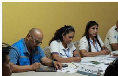
Imagen 7: Reunión de la Gabinete de Seguridad de Suchitepéquez.