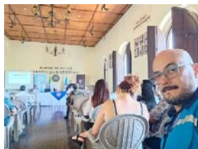
Imagen 2: Reunión de la CONRED de Retalhuleu, para actualización de miembros acreditados.