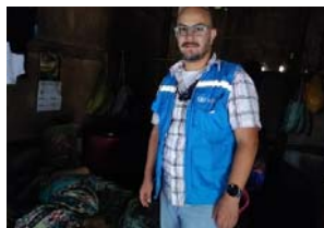
Imagen 4: Verificación de cumplimiento de medida cautelar.