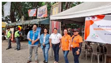
Imagen 6: Turno en Puesto de Control de SINAPRESE Retalhuleu.