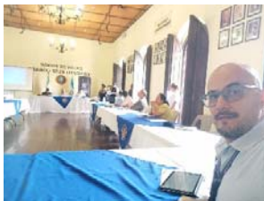
Imagen 1: Reunión de CODESACDH en Retalhuleu.