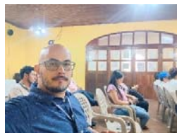
Imagen 3: Reunión de la Unidad Técnica Departamental de Suchitepéquez.