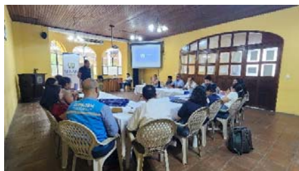
Imagen 8: Reunión de CODESAN de Suchitepéquez.