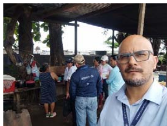
Imagen 5: Visita a comedores no autorizados en Km. 173 ruta CA-2 Occidente.