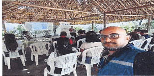
Imagen 5: Reunión de Red de Derivación de Suchitepéquez.