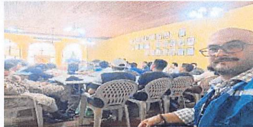
Imagen 2: Reunión de CODRED de Suchitepéquez.