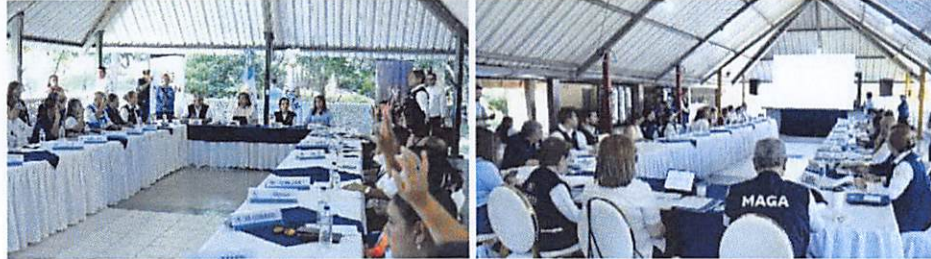
Imagen 4: Reunión de CODESAN de Suchitepéquez y visita de vicepresidenta de la República.